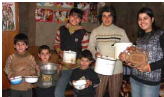
En fattig familie fik køkken inventar fra andre georgiske familier.