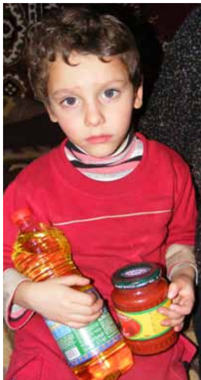
Fra julepakken til familien.