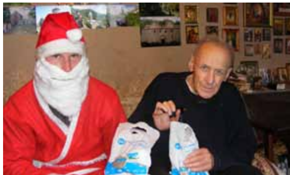
Tengiz på 93 sammen med julemanden. Den gamle mand kan som andre af vore pensionister kan ikke komme ud af sin lejlighed.